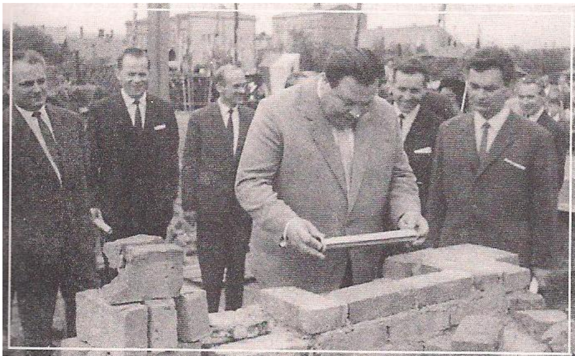
Wmurowanie aktu erekcyjnego (zdjęcie powyżej).